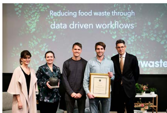
Deloitte Green Award 2017 表彰式